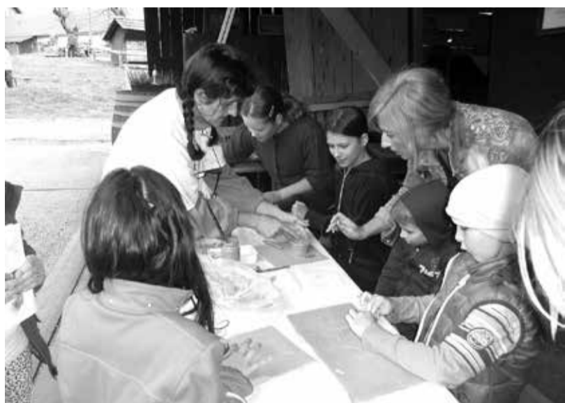
V starejši železni dobi še niso delali glinenih posod z lončarskim vretenom, ampak takole.