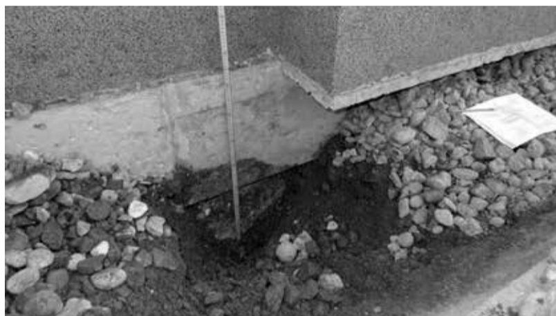
Energetski kiks št. 1: Toplotna izolacija dela stavbe v stiku z zemljo

Slika 1 prikazuje toplotno izolacijo stene v stiku z zemljo, ki pa ni izvedena skladno s priporočili stroke. Izolacija ni položena dovolj globoko v zemljo. Prav tako ne vemo zakaj je v delu, kjer je izolacija fasade nad zemljo debelejša, izolacija dela v zemlji toliko tanjša. Če ima stavba delno ali v celoti vkopano klet, je priporočljivo