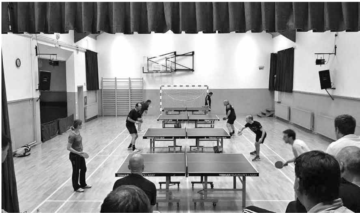
Ekipa ŠD Krka KGG2 ob zmagi nad ekipo Čistilni servis Orehek