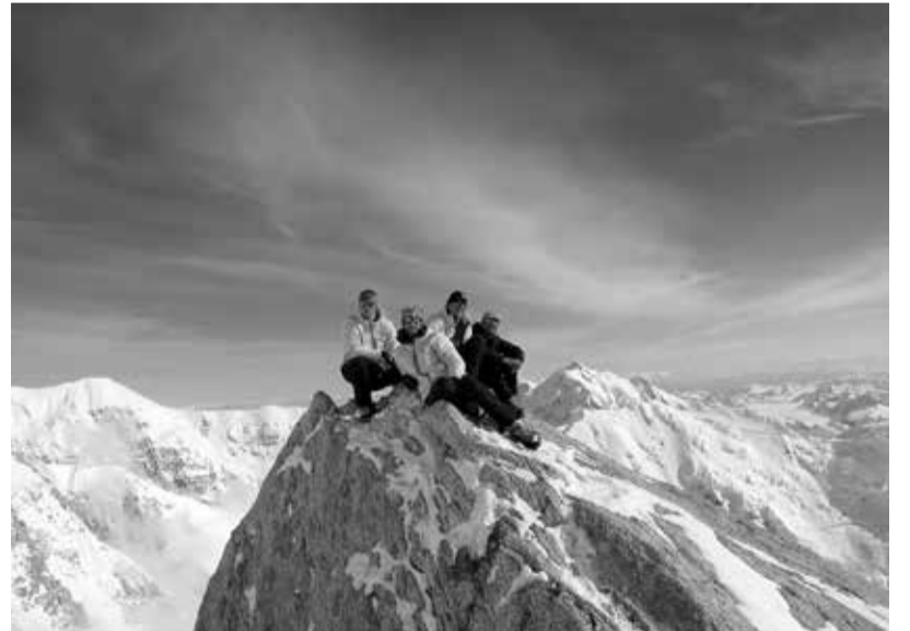
Člani odprave na Edge of the world dan pred odhodom

Takole ob večerih, kadar je jasno, so razgledi fantastični, človeku jemljejo dih, zato nas večina hodi po bazi ter fotografira, narava je res nekaj najlepšega kar, nas spremlja skozi življe-