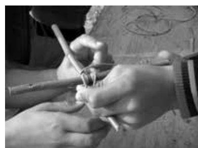
Takole se navzkriž povežejo »bruna« za ogrodje hiše.