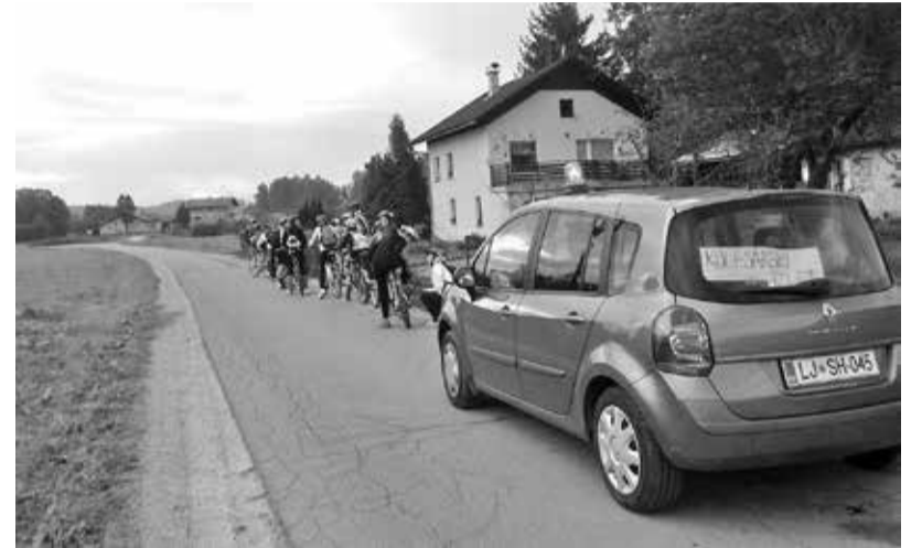
Od Glogovnice proti Pecam

Aktiv učiteljev športne vzgoje Srednje šole Josipa Jurčiča Ivančna Gorica je v sodelovanju z aktivom učiteljev športa na OŠ Stična organiziral kolesarski izlet po občini Ivančna Gorica, ki je potekala v soboto, 27. septembra. Ta izlet naj bi še poglobil sodelovanje šol iz naše občine (prvotno je bilo mišljeno, da naj bi se izleta udeležili tudi učenci OŠ Ferda Vesela iz Šentvida pri Stični). Obenem naj bi našim učencem in dijakom predstavil kraje in vasi, ki jih le redko vidijo ali pa sploh ne. Seveda je bil eden od glavnih ciljev izleta gibalna dejavnost-kolesarjenje, ki spodbuja zdrav življenjski slog.