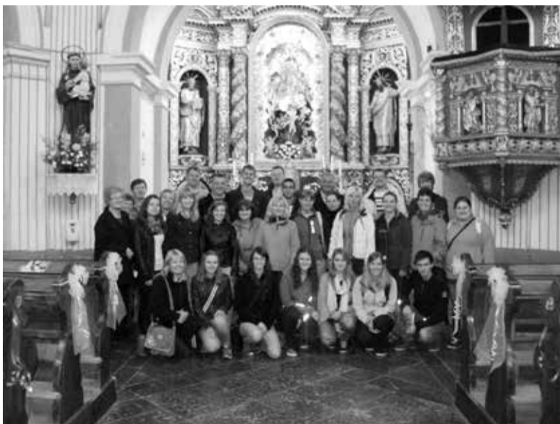
Skupinska fotografija pred oltarjev v cerkvi Sv. Marije v Novi Štifti

Po maši in seveda obveznem skupinskem fotografiranju je bil čas za malico. Okrepčani smo ob mogočni lipi zapeli še znano slovensko pesem Lipa zelenela je, potem pa se počasi odpravili proti gradu Snežnik. Resnično je vreden ogleda! Že takoj ob prihodu v grad nas je pozdravil več kot sto let star nagačen medved. Grad ima štiri etaže, ki te popeljejo v svet izpred sto let in več. Zanimivo je to, da so sobane opremljene s pristnim pohištvo, saj grad ni bil nikoli požgan. Videli smo tudi sobo v egiptčanskem slogu, pa grajsko klet, sobo, v kateri še vedno opravljajo poročne obrede, veliko lovskih trofej, prebrali smo jedilnik iz leta 1906, spoznali za-