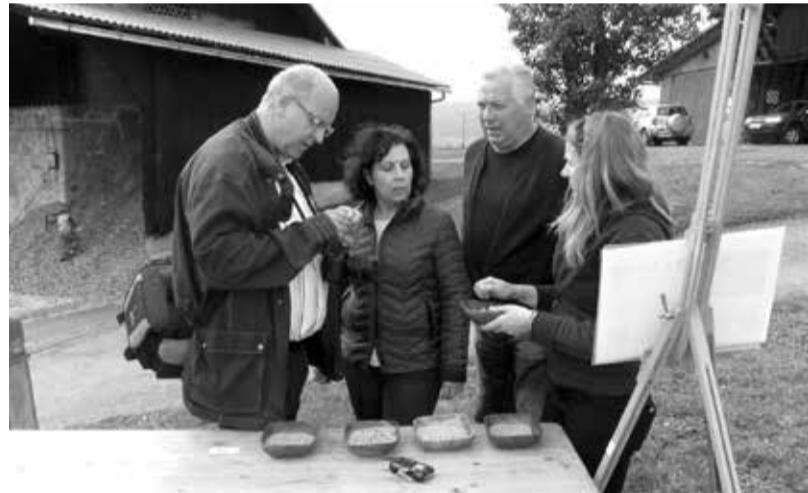
Tudi častna gosta župana Hirschaida in njegovo soprogo je zanimalo, kaj so sejali in jedli naši prednamci.

Tam je deset delavnic skušalo predstaviti utrinke iz življenja nekdanjih prebivalcev gradišča. Na vsaki je bil