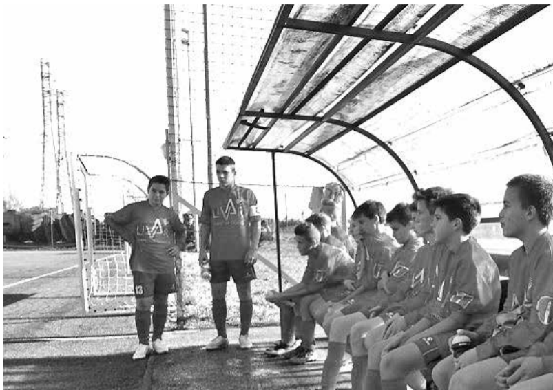
Ekipa U-15 med odmorom tekme proti ljubljanski Olimpiji.

Nogometna šola prav tako skrbi za svoj »najk« podmladek. Zaradi tega smo pred časom začeli izvajati športne in nogometne urice v vrtcih