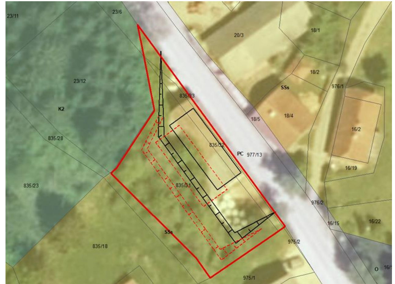
Prikaz predvidenega premika kozolca na izseku iz namenske rabe prostora v OPN Ivančna Gorica (črne linije: obstoječi kozolec z okoliškimi brežinami, rdeče: predlagani premik kozolca in povezanih ureditev)