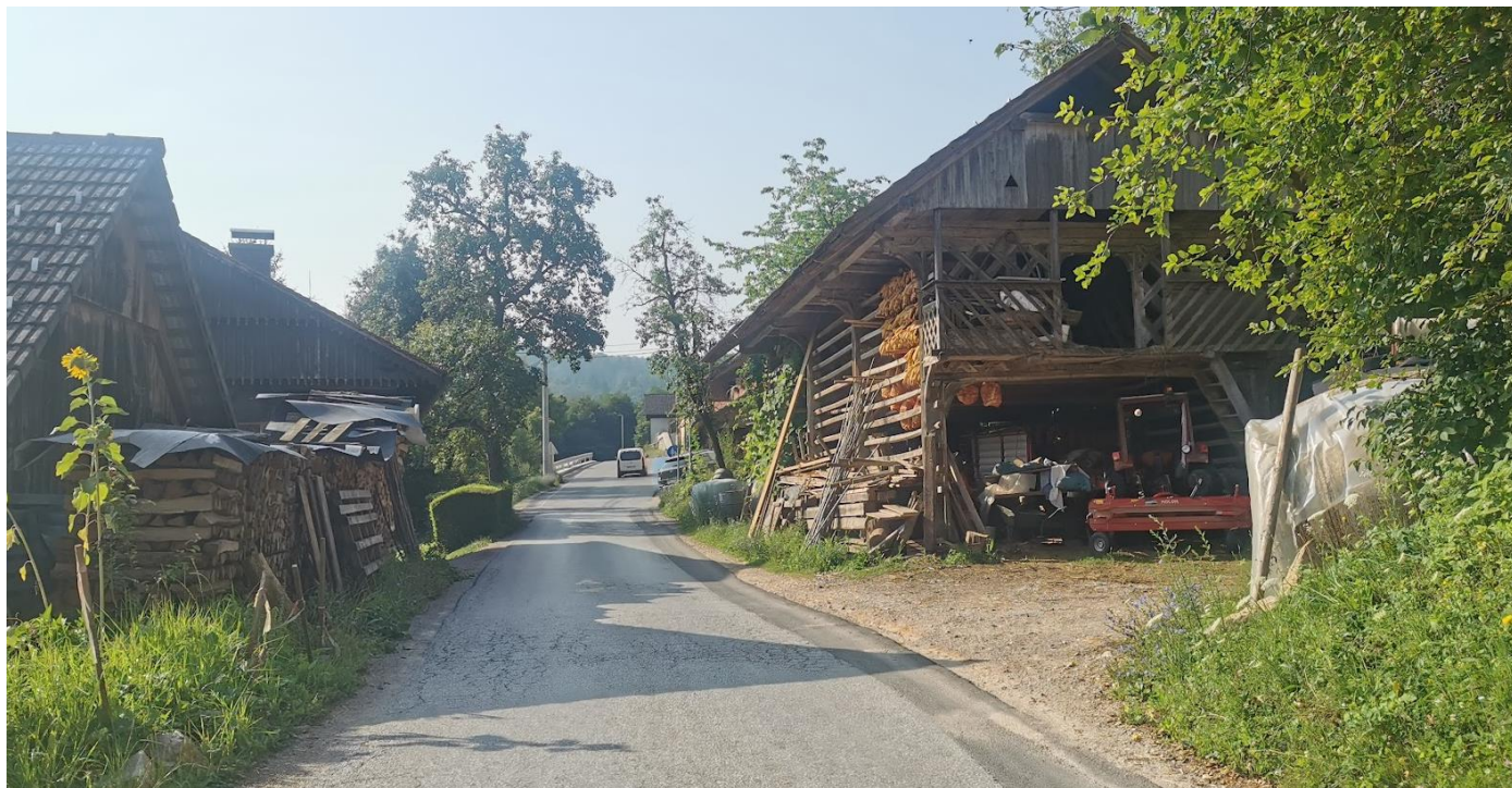
Pogled s severa po lokalni cesti; na levi kmetija, na desni kozolec